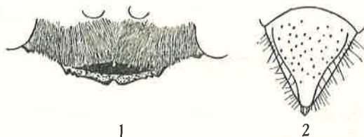
Fig. 1 et 2. — Tachysphex sordidus Dahlb. ♀. 1. Clypéus. 2. Aire pygidiale.

crure nette au milieu et une petite dent près des angles latéraux, eux-mêmes saillants (fig. 1). 2 e et 3 e articles du funicule 3 fois plus longs que larges. Ponctuation de la face fine et dense, les espaces plus petits que les points. Distance interoculaire au vertex un peu plus grande que